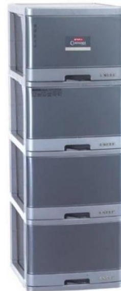
Gambar 3. Lemari Plastik Susun 4