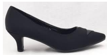
Gambar 4. Sepatu Pantofel dengan Hak Lancip