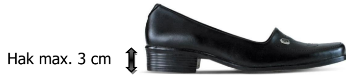
Gambar 1. Sepatu Pantofel