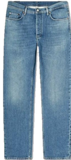
Gambar 2. Celana Jeans