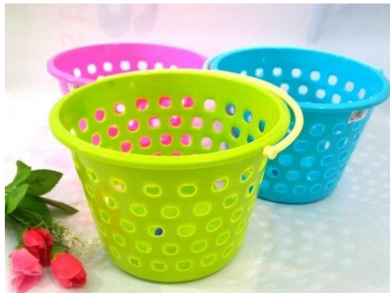
Gambar 4. Wadah Sabun