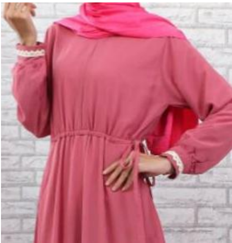
Gambar 3 . Gamis kerut pinggang