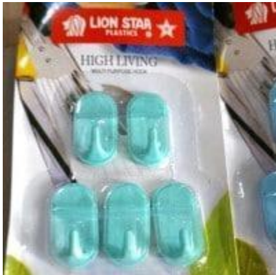
Gambar 2. Kapstok