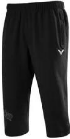
Gambar 1 . Celana 3/4